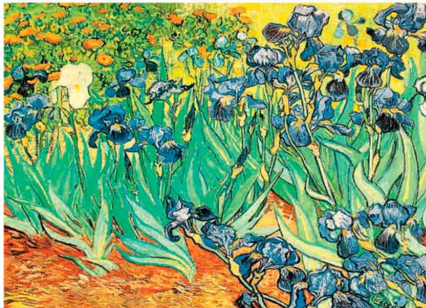
Van Gogh, Perunike, 1889

Slikar Vincent van Gogh Povezava med genialnostjo in duševno boleznijo